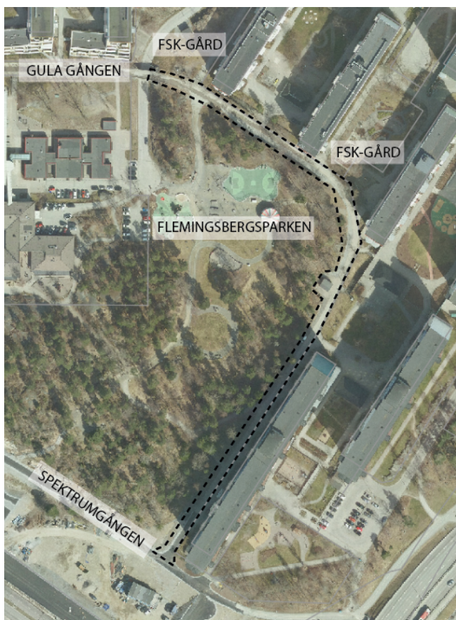
Figur 1. Flygbild där gångstråket är markerat med streckad linje.

I enlighet med samhällsbyggnadsprocessen delas beslut kring upprustningen upp i två olika delar, dels ett inriktningsbeslut för att starta planeringen av innehållet och utformningen (vilket fattades av KS 4 juni 2025), dels ett genomförandebeslut med förslag på utformning och budget för att starta upprustningen. Enligt nuvarande tidplan handlas entreprenaden upp och kan påbörjas till första kvartalet år 2026 och projektet färdigställs till vintern 2026.